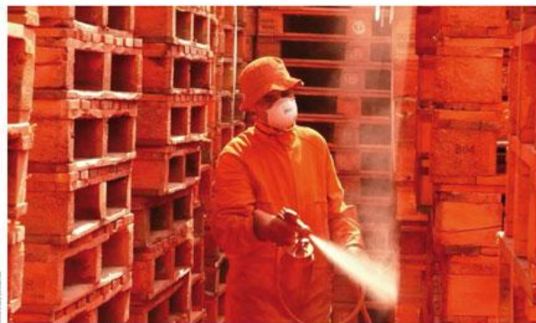
Recharger le peigneur de rouge.

Le récit ne quittera pas l'entreprise de réparation de palettes que dirige d'une souple poigne le madré Mao. Le premier dialogue expose l'enjeu narratif : la décision du patron de construire pour ses employés une mosquée au sein même de l'entreprise. Geste convaincu et généreux d'un patron soucieux de favoriser l'expression culturelle de ses ouvriers ou manoeuvre intéressée pour se payer la paix sociale, la motivation de Mao restera indécidable. Dans Wesh Wesh , constatant la primauté des rapports de classe sur toute solidarité ethnique, Kamel concluait : « Les patrons c'est tous les mêmes, ils se font de l'argent sur le dos des travailleurs. » Devenir patron, pour le cinéaste-acteur, c'est d'abord confirmer le cliché, puis le contester, selon la pente ascendante d'une oeuvre qui, de film en film, conserve sa colère à l'encontre des structures de la domination, mais se déleste de la paresse politique et esthétique d'un report de ces structures sur des personnages monolithes. Reste que l'ouverture de la mosquée est aussi celle d'un espace démocratique qui ne tardera pas à se retourner contre le patron coupable d'avoir nommé l'imam, alors que la tradition musulmane veut qu'il soit choisi par l'assemblée des fidèles.