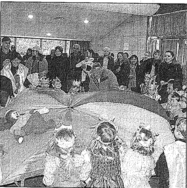
Des princesses et des chevaliers à gogo.