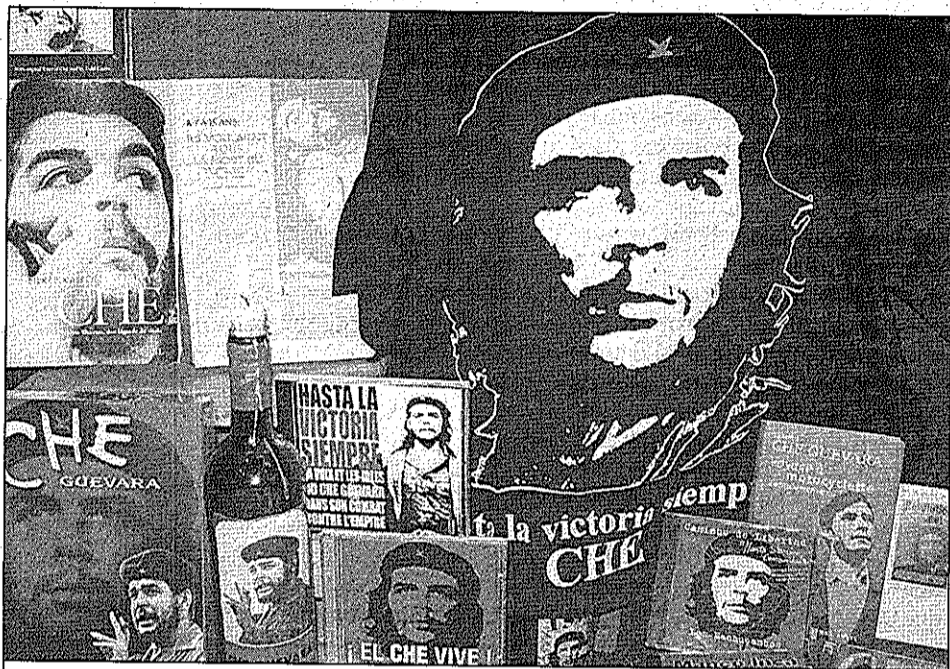
Le révolutionnaire argentin, devenu malgré lui icône commerciale, rejoint enfin l'univers hollywoodien sous le regard de Steven Soderbergh.

C'est à une double séance exceptionnelle que Cinéactions convie tous les cinéphiles ce dimanche. En effet, l'événement de février est la diffusion intégrale, salle Juliette-Gréco, de la vaste fresque en deux parties de Steven Soderbergh sur Ernesto « Che » Guevara. L'auteur de « Sexe, mensonges et vidéo », Palme d'or à Cannes en 1989, réalise un vieux rêve d'Hollywood : porter à l'écran la vie de l'illustre révolutionnaire sud américain, dont l'image culte immortalisée par Alberto Korda a fait le tour du monde. Mais, au-delà de l'image, combien d'adolescents arborant l'effigie du Che sur leur T-shirt connaissent réellement l'itinéraire de celui qui fut l'une des voix fortes du Tiers-monde? Entre la vision d'auteur et le « bio-pic » plus traditionnel, le pari de Soderbergh est audacieux. Pour le rôle principal il a choisi Benicio del Toro, véritable incarnation du Che, dont les criti-